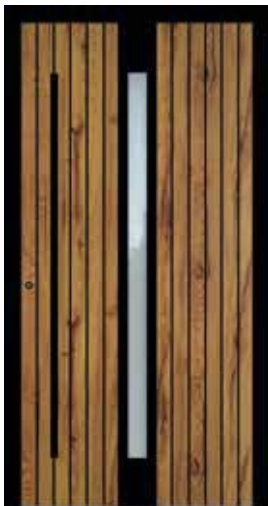
SERIE - BLACK GROOVE

Neue Modelle mit Stadlholz + Tiefschwarz